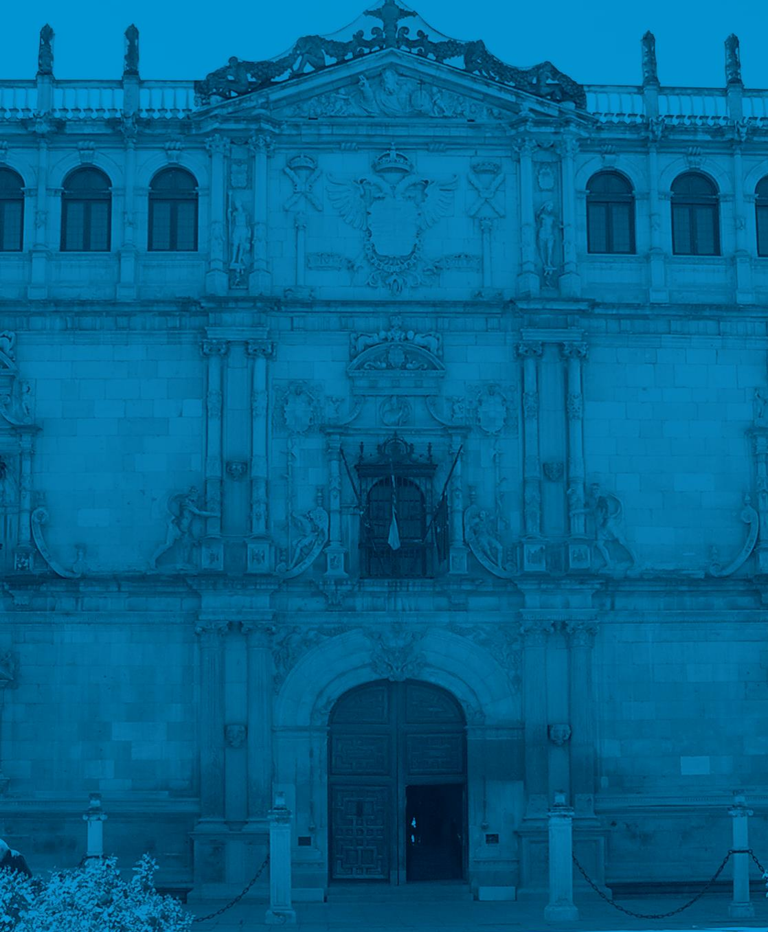
Sede del Instituto Nacional de Administración Pública (INAP), Alcalá de Henares